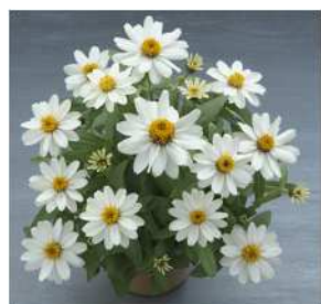
ホワイト 登録品種（品種名：TZ957） 海外持出禁止 (公示（農水省 HP）参照)