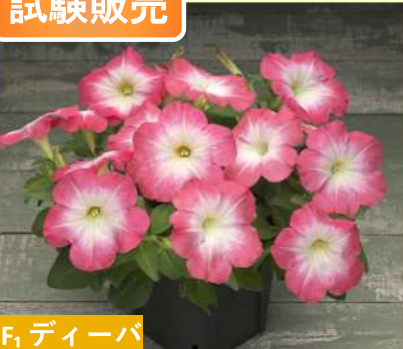
F 1 ディーバ TX1012(チェリーモーン)