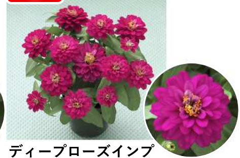
ディープローズインプ (TZ1065) 品種登録出願中（品種名：TZ1065）