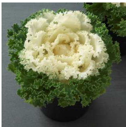
F 1 白つばめ

着色部は明紅色で葉縁の波打ちが大きく、ボリューム感がある。すずめ・かもめ系より早い時期から着色し、草勢はすずめ・かもめ系より強い。葉数多く、しまりがよい。