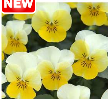
イエロービーコンフィールド (STV287)

丸弁で白色がはっきりしたコントラストのよい黄色のビーコンカラー。株のまとまりに特に優れる。