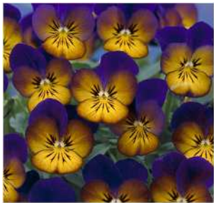
ゴールドンブルース シックな中にも輝きのある 花色。やや小輪で抜群の 花上がり、耐寒性も強い。