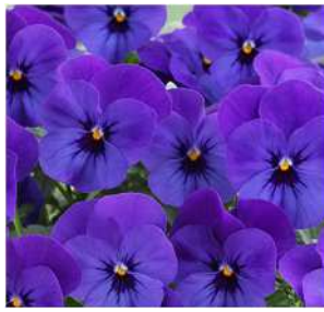
ディープブルー 深みのある印象的なブルー。 大輪花がややアップライトに 咲きよく目立つ。