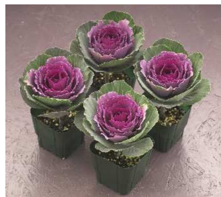
F 1 冬紅

着色部は明るい濃紅色で、外葉は葉数多く、上向きにまとまる。冬紅に比べると全体に濃い印象。草丈60~65cm。