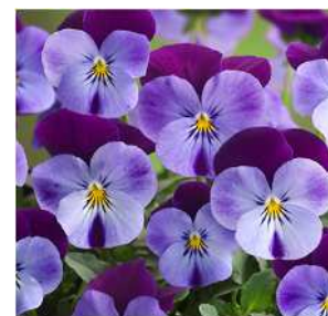
ライラックパープルウイング ライラックブルーとパープルの シックな組み合わせで 独特の存在感を発揮。