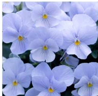
ヘブンリーブルー

ヘブンリーブルーの発芽・ 生育揃いを改良し、生産性が 大きく向上した。高温期は下 弁が若干薄めに発色する。