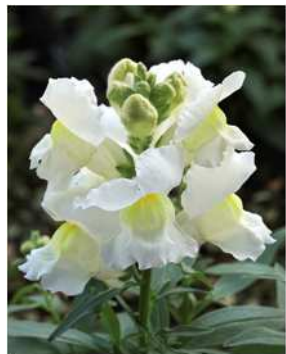
ホワイ ※ピンク色株が 出現することがある。