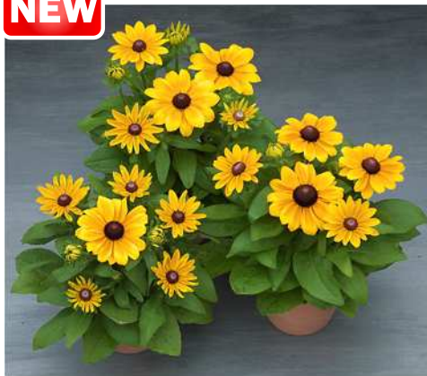
F 1 クレア ステイゴールド(TR1015)