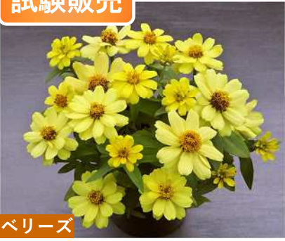
ベリーズ TZ970(ベリーズイエロー) 登録品種 (品種名: TZ970) 海外持出禁止 (公示 (農水省 HP) 参照)