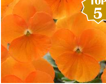
トゥルーオレンジ 濃いオレンジでよく目立つ。花首短くコンパクト。