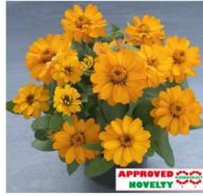
オレンジ 登録品種（品種名：TZ963） 海外持出禁止 (公示（農水省 HP）参照)