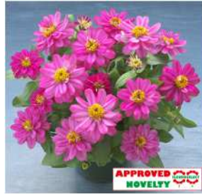
ディープローズ 登録品種（品種名：TZ960） 海外持出禁止 (公示（農水省 HP）参照)