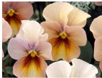
ブロンズシェード アプリコットからサーモンブロンズ色のシックで明るいアンティークシェード。 ※今期プラグ苗販売のみ