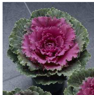
F 1 紅つぐみ

白はとに比べコンパクトに仕上がる。葉は立性で葉数も多く着色部は白色で中心は淡桃色。