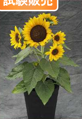
ひまわり TH1077 (F 1 サンキューティー)