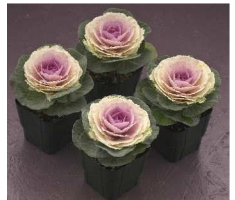
F 1 バイカラートーチ

着色部は淡紅色、草丈65~70cm程度で草姿は晴姿SP、初紅とも合わせやすい。葉数多く立性。