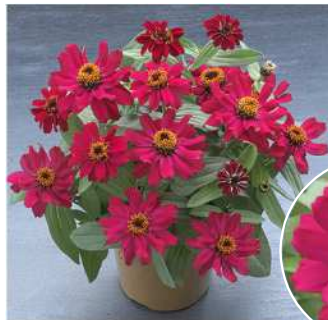
ディープローズ 登録品種（品種名：TZ959） 海外持出禁止 (公示（農水省 HP）参照)