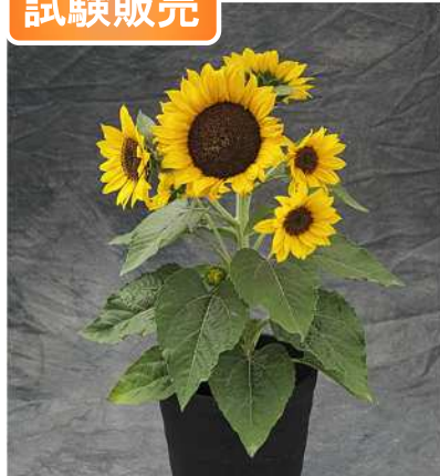
TH1077 (F 1 サンキューティー)