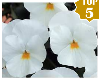
ホワイト 株張りのよい人気品種。上弁紫の個体が出現することがある。