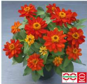
スカーレット 登録品種（品種名：TZ964） 海外持出禁止 (公示（農水省 HP）参照)