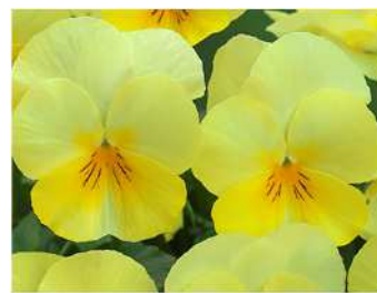
クリアレモン 花色に濃淡の幅がある。株張りはややおとなしめ。