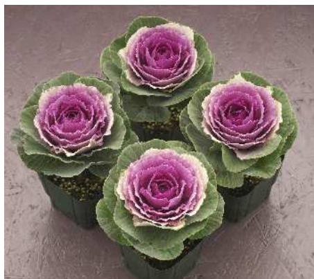
F 1 ウィンターチェリー

着色部は紫がかった濃紅色で、葉は開帳性で先端は丸い。初紅に比べると葉色は全体に明るい印象。草丈60~65cm。