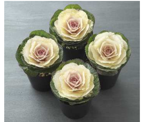
F 1 初夢

晴姿の改良タイプで揃い性が向上。性質は晴姿同様に立性の小葉で重ねがよく、着色部は白色で中心部が少し桃色みを帯びる。草丈約70cm、花径15cm程度にまとまる。