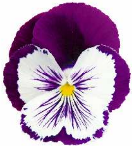
パープル&ホワイト