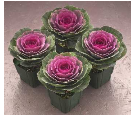
F 1 初紅

晴姿SPと似た草姿で小葉、立性。着色部は濃紅色で外葉とのコントラストが綺麗。着色はやや遅め。草丈約70cm。