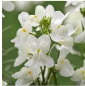
ホワイ 登録品種（品種名：TF701）