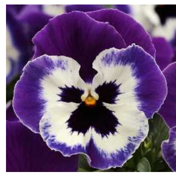
パープルフェイス