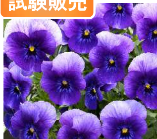
STV311 (パープルオーキッド)