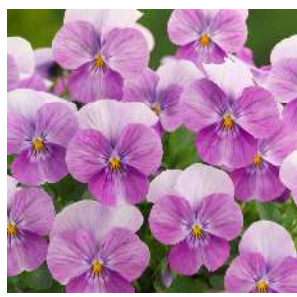
ピンクビーコン ラベンダーピンクのビーコン花色。 大輪で生育旺盛、花数多く ガーデンプフォーマンスに優れる。