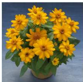
オレンジ 登録品種（品種名：TZ958） 海外持出禁止 (公示（農水省 HP）参照)