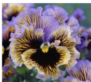
イエローブルースワール イエローにブルーピコティのシェード。目入り。