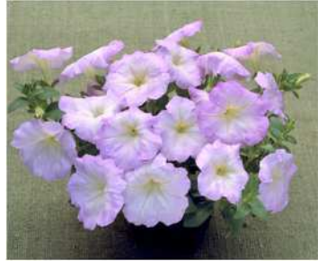
ラベンダーピンク