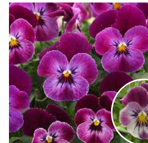
ラズベリー 発色例 存在感のあるラズベリーローズ。 適度なボリューム感のあるマウンド状 の草姿で、花立ちよくポットパフォー マンスに優れる。 温度や時期により発色に濃淡あり。