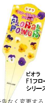
ビオラ F1フローラルパワー シリーズ