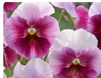
フロスティローズ ローズからピンクの濃淡があるシェードタイプ。