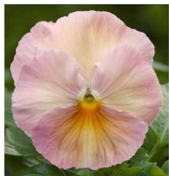
アプリコットシェードインプ