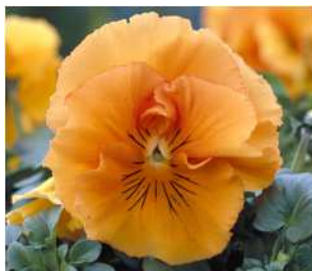
オレンジ ヒゲもユニークなオレンジ色。