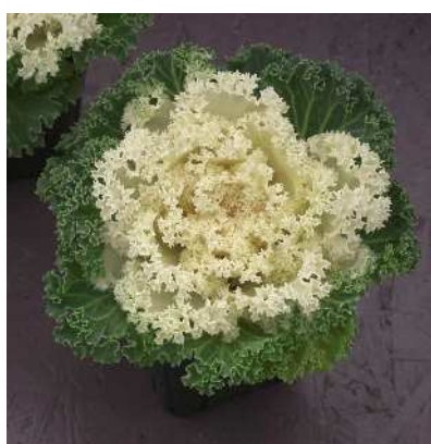
F 1 白かもめ

特に葉数が多く、着色の早さと安定度で人気。着色部の明るい赤色と、よくしまった外葉の緑色とのコントラストが非常に美しい。