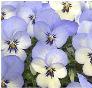
ブルーピコティ アイボリーホワイトに ブルーのピコティ。 低温期には花色の青みが増す。