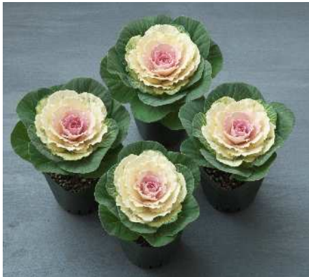
F 1 冬うらら