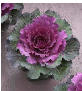
F 1 改良紅はと

葉数が多く、しまりのよい系統。全体がコンパクトにまとまる。外葉の濃緑色と着色部の鮮紅色との対比の美しい品種。