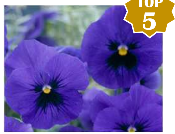
オーシャン ブルー系の定番色。