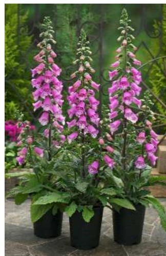
F 1 パンサー