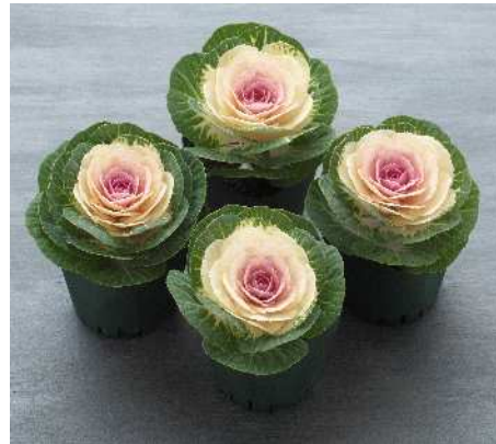
F 1 晴姿SP

晴姿の改良タイプで揃い性が向上。性質は晴姿同様に立性の小葉で重ねがよく、着色部は白色で中心部が少し桃色みを帯びる。草丈約70cm、花径15cm程度にまとまる。