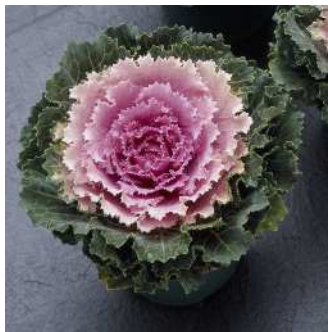
F 1 桃つぐみ

特に葉数が多い。普通栽培では着色部が純白色で芯が桃色になるが、矮化剤を利用して小作りにすると、全体が桃色となり桃色系の品種としても通用する。大株でも姿が乱れないので利用価値が高い。