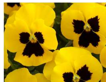
イエローブロッツインプ 大きめのブロッツ。花首短く株のまとまりがよい。