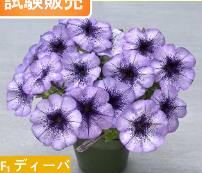
F 1 ディーバ TX1083(ブルーベイン)