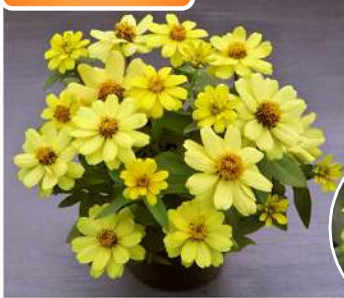
TZ970(イエロー) 登録品種 (品種名：TZ970) 海外持出禁止 (公示（農水省 HP）参照)