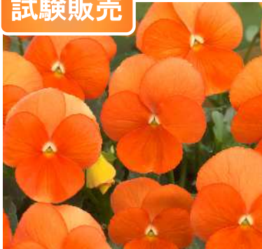
TV884(ディープオレンジ)

唯一無二のクリアなディープオレンジ。 丸弁の大輪で花色がより際立つ。 生育旺盛で作りやすい。