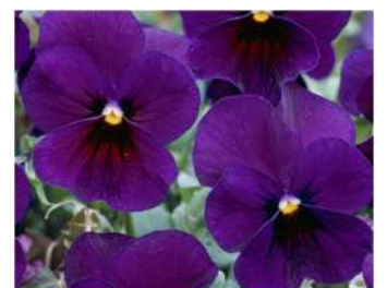
プラムパープル 株のまとまりがよい。低温期は赤みが増す。