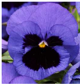
ブルーブロッチインプ