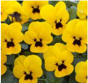
イエローウィズブロッツ 黄色に黒ブロッツ。 横張り性の強い草姿。