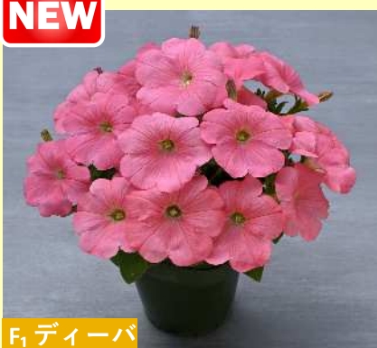
F 1 ディーバ ピーチ(TX1081)