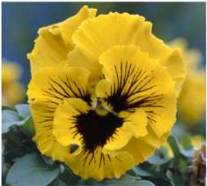
イエロー 黄色に目入り。