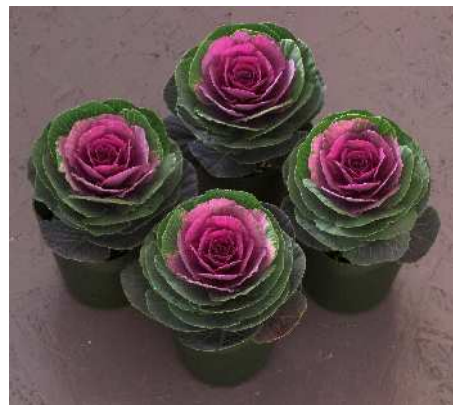
F 1 恋姿

晴姿SPと似た草姿で小葉、立性。着色部は濃紅色で外葉とのコントラストが綺麗。着色はやや遅め。草丈約70cm。