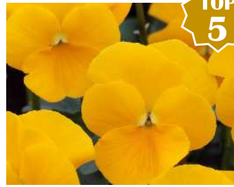
クリアイエロー イエローより大輪で色も濃くよく目立つ。早出しでも花首伸びずコンパクト。