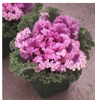
F 1 桃かもめ