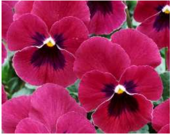
ローズ 濃いめのローズで目入り。やや晩生だが花立ちよい。