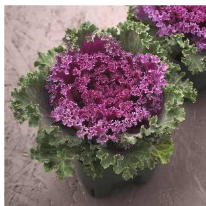
F 1 紅すずめ

特に小型に仕上がる実用系統で、ポット栽培用として絶大な人気種。葉数が多く、ボリュームに富む。着色部は濃紅色で着色が早い。耐寒性が強いので、どの地域にも向く。