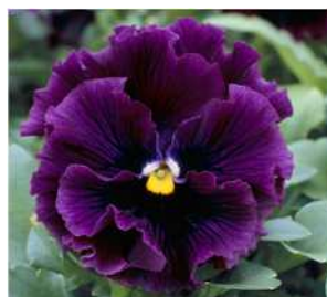
バーガンディ 赤紫のシェードに目入り。