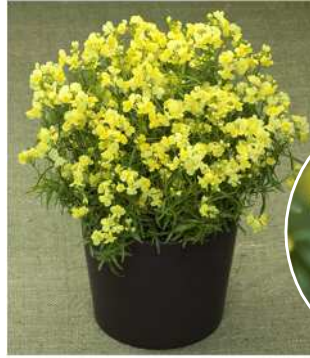
イエロー 登録品種（品種名：TF700）