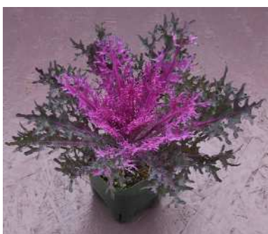
F 1 紅くじゃく

着色部はやや暗い紅色で外葉も赤みを帯びる。耐寒性が強く、抽苔も遅い。冬～早春花壇や寄せ植え素材にも。