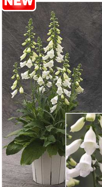
F 1 Hanabee ホワイト