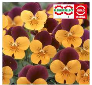
オレンジレッドウイング オレンジに赤紫の上弁。 フロロセレクト金賞受賞。