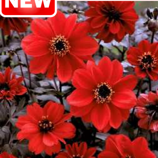
ダリア ブラックフォレスト ルビー