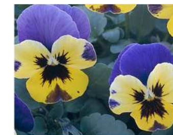
ブルー&イエロー 青と黄色のコントラストが鮮やかなユニークカラー。