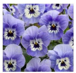
マリナー 花上がり・連続開花性・ 株張りいずれも優れ、 多くの受賞実績を持つ注目品種。