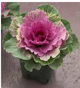
F 1 紅はと

葉数が多く、しまりのよい系統。全体がコンパクトにまとまる。外葉の濃緑色と着色部の鮮紅色との対比の美しい品種。