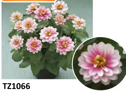
TZ1066 (ピンクラゲーン) 品種登録出願中（品種名：TZ1066）