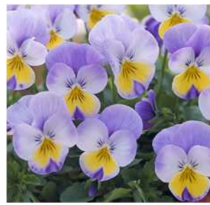
(スーパー)ローズウイング ライラックローズに黄芯の シェードタイプ。 大輪で生育旺盛。