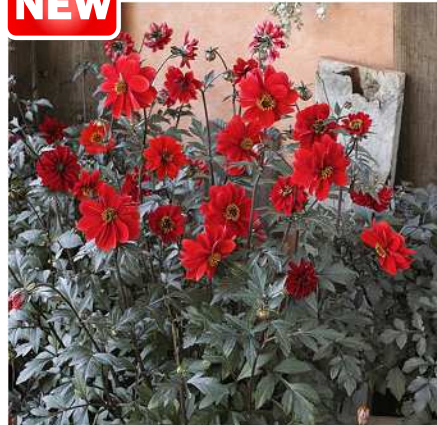
ブラックフォレスト ルビー