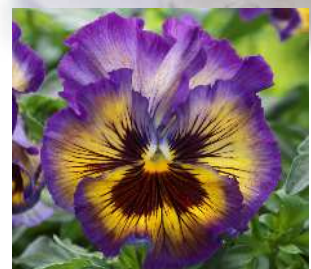
レモンベリー レモン~イエローにローズ~パープルのピコティシェード。目入り。