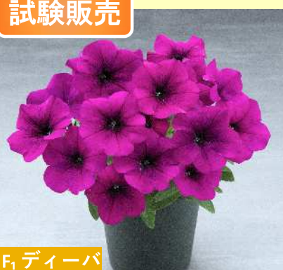
F 1 ディーバ TX1038(パープルインプ)