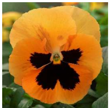
オレンジブロッチインプ