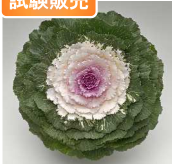
TB1108(F 1 つぐみ S P)

つぐみの改良タイプで揃い性が向上。性質はつぐみ同様に葉枚数多く、着色部が純白色で芯が桃色になる。