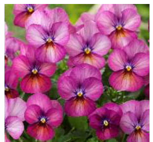
プラムアンティーク アンティーク調のプラムパー プルシェード。分枝性に優れ 横張りのよい草姿。温度や時 期により発色に濃淡あり。