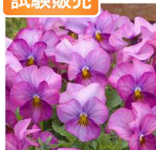
STV290 (プラムアンティークGen2)

株のまとまりよく花首も伸びづらく栽培しやすい。プラムアンティークより花色が濃い。