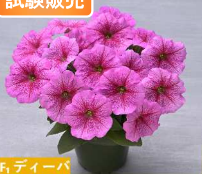
F 1 ディーバ TX1082(ローズベイン)