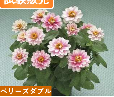
ベリーズダブル TZ1066(ピンクラグーン) 品種登録出願中 (品種名: TZ1066)