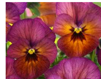
マルベリー ルビーレッドからサーモンローズの暖色系アンティークシェード。