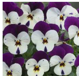
パープルパールズ ディープパープル&パールホワイ トのバイカラー。コンパクトな が適度に横張りし、ポットでの収 まりがよく作りやすい。