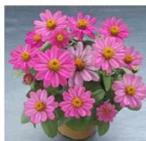
ローズ 登録品種（品種名：TZ956） 海外持出禁止 (公示（農水省 HP）参照)