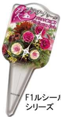
F1ルシール シリーズ