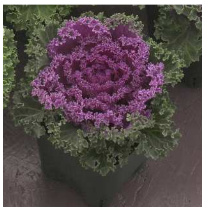
F 1 紅かもめ

特に葉数が多く、着色の早さと安定度で人気。着色部の明るい赤色と、よくしまった外葉の緑色とのコントラストが非常に美しい。