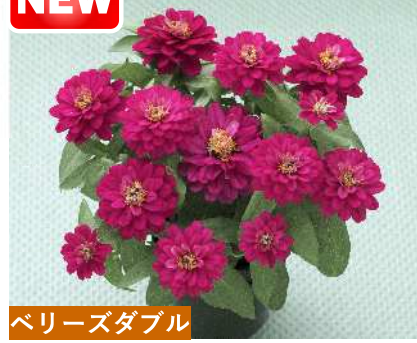
ベリーズダブル ディープローズインプ(TZ1065) 品種登録出願中 (品種名: TZ1065)