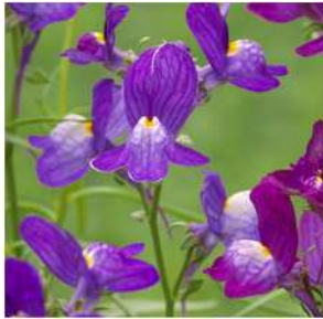
バイオレット 登録品種（品種名：TF699）