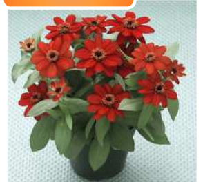
TZ1068(レッド) 品種登録出願中 (品種名：TZ1068)