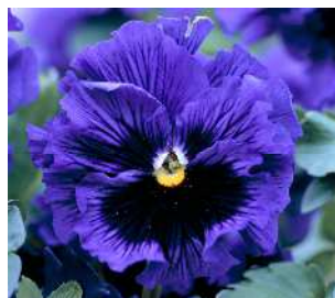
ブルー ブルーシェードに目入り。