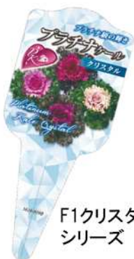
F1クリスタル シリーズ