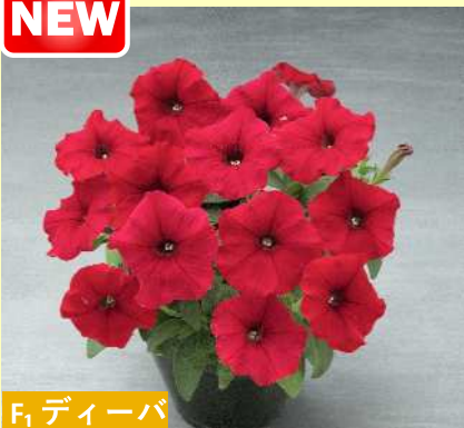
F 1 ディーバ レッドインプ(TX1037)