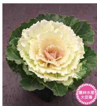
F 1 白はと