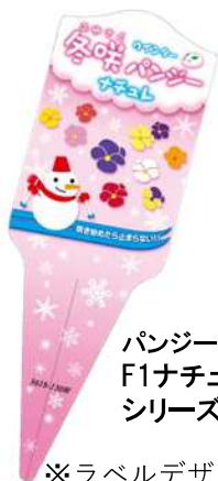
パンジー F1ナチュレ シリーズ