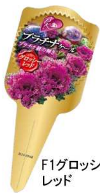
F1グロッシェー レッド