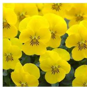
イエローサプライズ 明るい黄色にはっきりと したヒゲが入る。 株張りよく作りやすい。