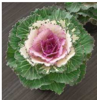
F 1 つぐみ

つぐみの改良タイプで揃い性が向上。性質はつぐみ同様に葉枚数多く、着色部が純白色で芯が桃色になる。