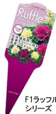
F1ラッフル シリーズ