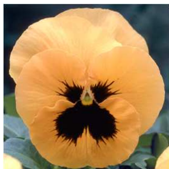
オレンジブロッチ