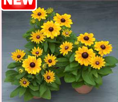
ルドベキア F 1 クレアステイゴールド (TR1015)