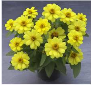
イエロー 登録品種（品種名：TZ962） 海外持出禁止 (公示（農水省 HP）参照)