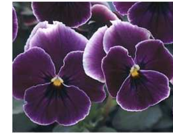
シュガーグレープ 赤紫に白覆輪。大輪で多花性。高温期は花色が薄くなることがある。