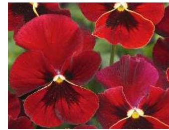
レッドウィズブロッツ 赤の目入り。株のまとまりがよい。