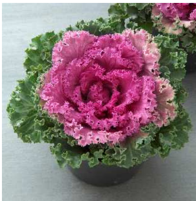
F 1 紅つばめ

着色部は明紅色で葉縁の波打ちが大きく、ボリューム感がある。すずめ・かもめ系より早い時期から着色し、草勢はすずめ・かもめ系より強い。葉数多く、しまりがよい。