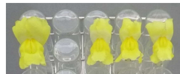
ポップアップ 従来シリーズ