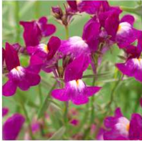
ローズ 登録品種（品種名：TF697）