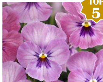
ローズピンク ローズからピンクの濃淡があるシェードタイプ。