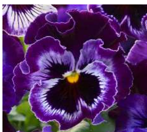
ラズベリー ラズベリーローズにホワイトフェイスのシェード。目入り。