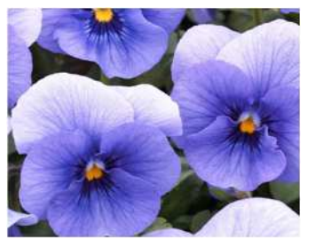
ブルーインプ 透明感のあるブルー。横張り型で株張りよい。