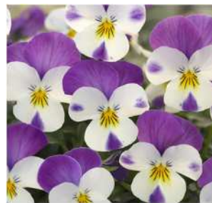
ペルシアンピンク パープルピンクの上弁に イエロー芯がアクセント。