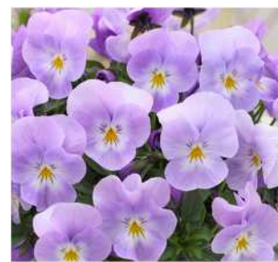
ラベンダーピンク 花上がりよくコンパクト。 気温により色合いが変わる。