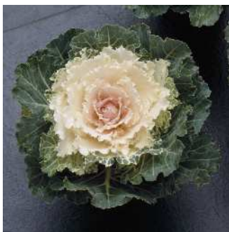
F 1 白つぐみ

従来品種には無い桃色。葉は立性で葉数も多く、コンパクトに仕上がる。着色部は桃色で外葉は緑色。