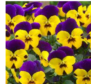
インディアンサンセット 上弁濃紫に下弁黄色の 組み合わせ。 ゴールドパープルウイング に比べ旺盛。