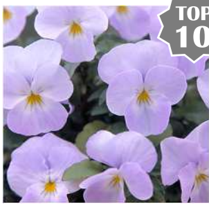
(スーパー)ソフトピンク 淡いピンクの大輪種。 4%程度ローズ個体が出る。