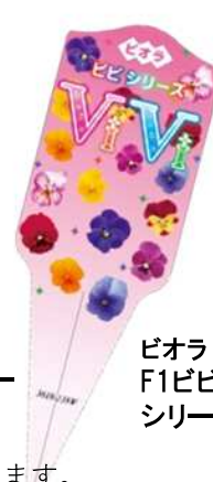
ビオラ F1ビビ シリーズ