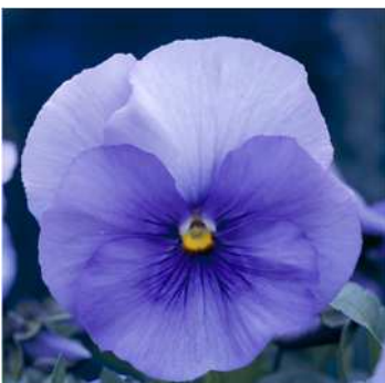
ライトブルーブロッチ