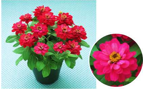
チェリー 品種登録出願中（品種名：TZ1064） 発色の良い独特なチェリー色が特徴的。高温期でも色褪せしない。シリーズ内ではやや旺盛。