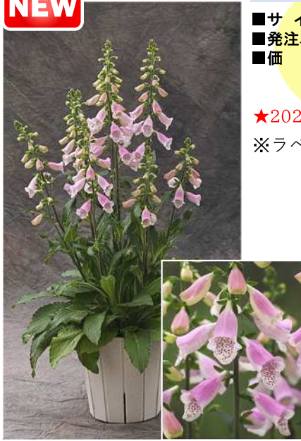
F 1 Hanabee ピンク

「花火」が上がるように複数本の花が同時に開花する多花性が最大の特徴。「パンサー」よりも約1週間早生。草丈は40~60cmとややコンパクトで長期間にわたり咲き続ける。低温要求性が少なく年明け後の定植で5月頃から出荷可能で、基本的にピンチや矮化剤は不要。ホワイトはジギタリス特有の斑点模様が目立ちづらく、すっきりとした花色。