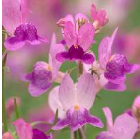
ピンク 登録品種（品種名：TF698）