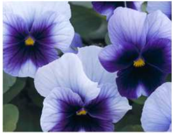
ビーコンインプ 株張りが改良されたビーコンカラー。