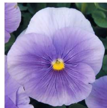
クリアライトブルー