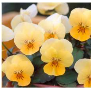
アプリコットリップ 他品種にない独特の アプリコット色が 秋シーズンにぴったり。