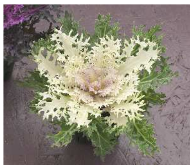
F 1 白くじゃく

着色部はやや暗い紅色で外葉も赤みを帯びる。耐寒性が強く、抽苔も遅い。冬～早春花壇や寄せ植え素材にも。