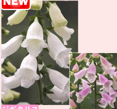
ジギタリス F 1 Hanabee ホワイト ピンク