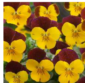
イエローレッドウイング コンパクトで花立ちよく 作りやすい。上弁の赤色の鮮や かさにも注目。