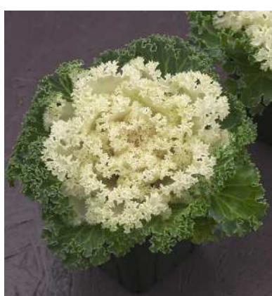
F 1 白すずめ

特に小型に仕上がる実用系統で、ポット栽培用として絶大な人気種。葉数が多く、ボリュームに富む。着色部は濃紅色で着色が早い。耐寒性が強いので、どの地域にも向く。