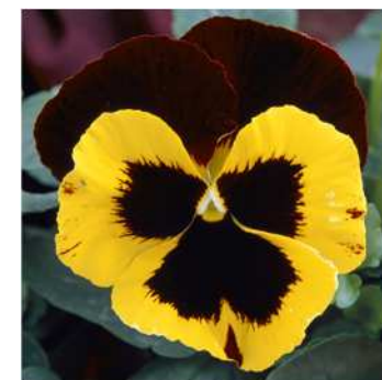
レッド&イエローブロッチ