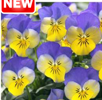
イエローブルーウイング (STV282)