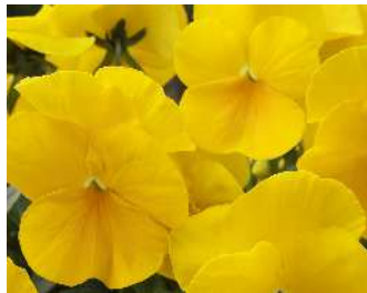
イエロー 黄色の濃さで人気。花径やや小さくコンパクトな草姿。