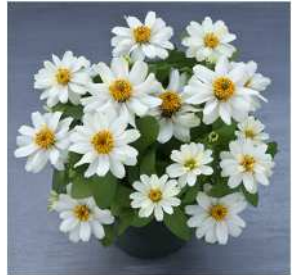
ホワイト 登録品種（品種名：TZ961） 海外持出禁止 (公示（農水省 HP）参照)