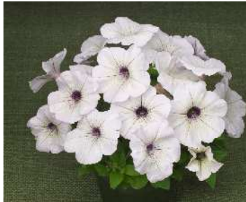
シルバーブロッチ