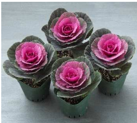
F 1 恋衣