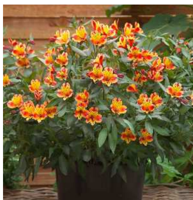
アルストロメリア インディアンサマー