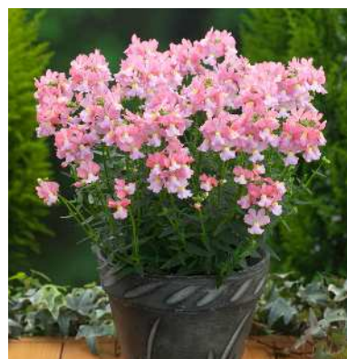
ネメシア フラミンゴ