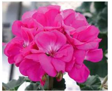
バイオ (バイオレット)