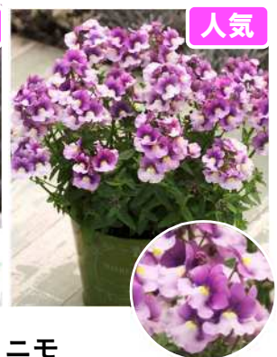
レモンスカッシュ