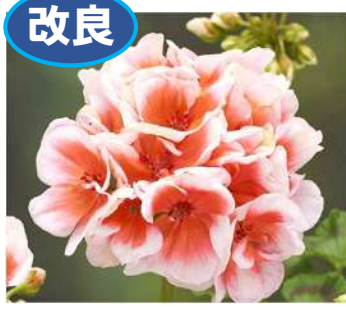
ジェシー'26 (サーモン) 分枝がより良く改良。