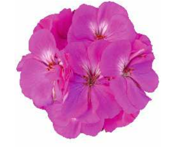
ビビアン (オーキッド)