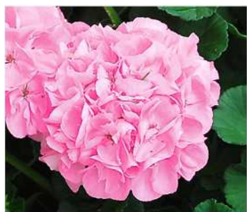
ゴエスタ (ライトピンク)

登録品種 (品種名:KLEPZ17509) 海外持出禁止 (公示 (農水省HP) 参照)