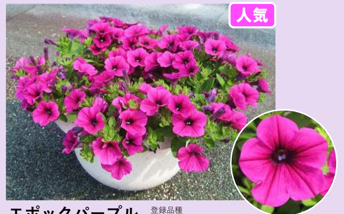
エポックパープル