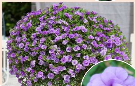
ネオダブル ライトブルー

登録品種(品種名:KLECA16364) 海外持出禁止(公示(農水省HP)参照)