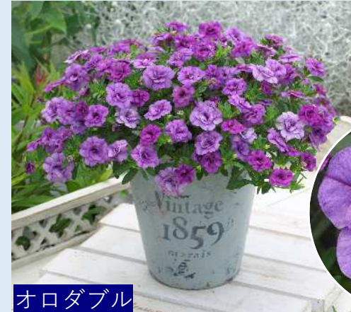
オロダブル ライトブルー