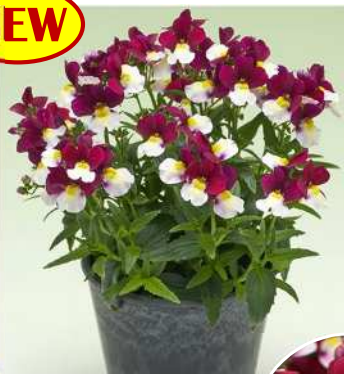
チェリーベリー 鮮やかな花色が 魅力的！