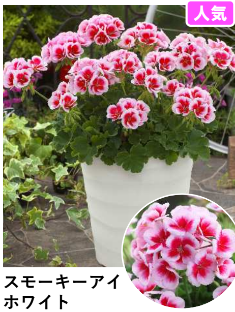
スモーキーアイ ホワイト (ホワイトスプラッシュ)