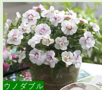
ウノダブル ホワイト ピンクベイン