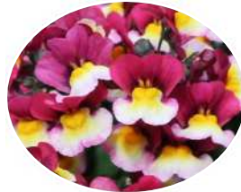
アップルパイ やや分枝少なく、生育遅め。