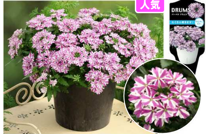
ラベンダースター