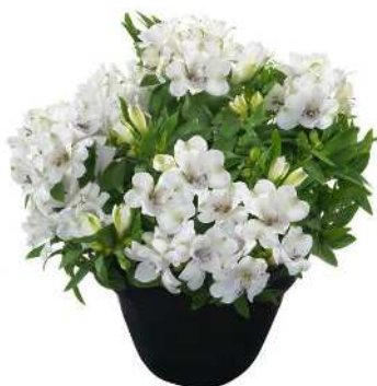
マジックホワイト