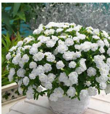
カリブラコア オロダブル ホワイト