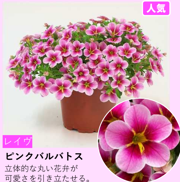
レイヴ ピンクバルバトス 立体的な丸い花卉が 可愛さを引き立たせる。