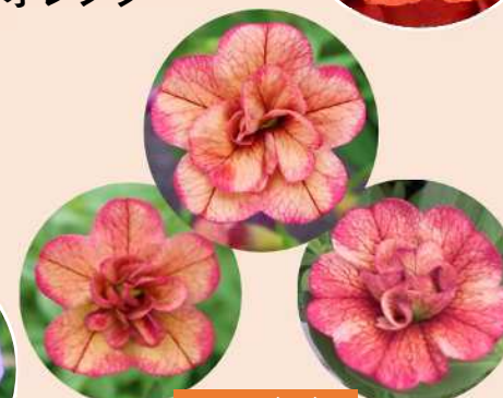
ネオダブル アプリコットレッド