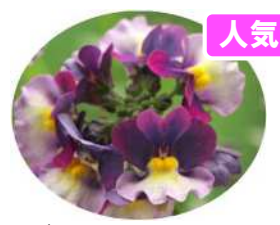
ピーチパイ スイーツのような花色。 株はやや伸びやすい。