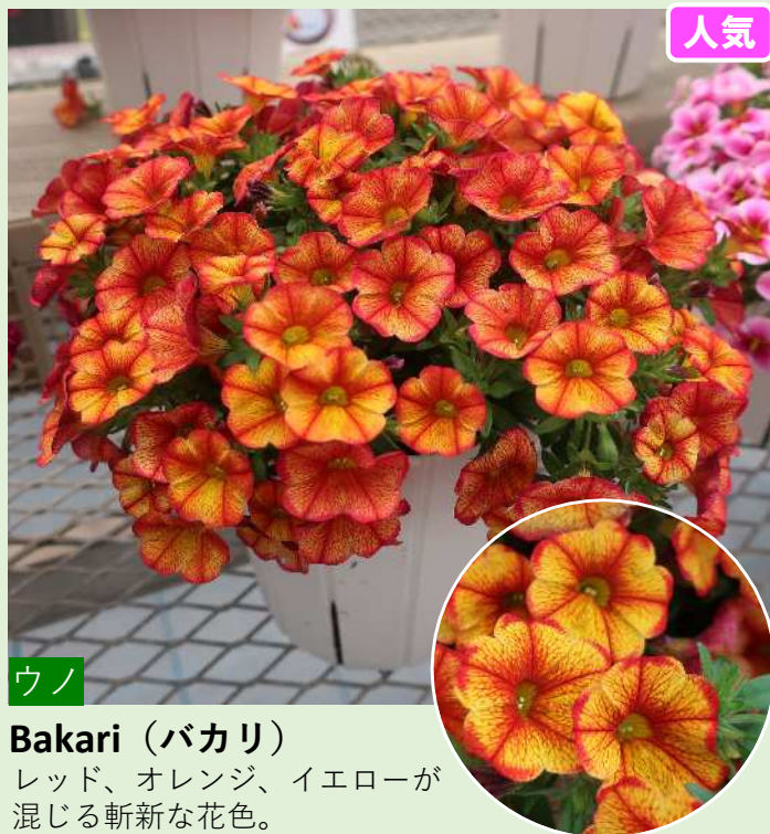
ウノ Bakari (バカリ) レッド、オレンジ、イエローが 混じる斬新な花色。