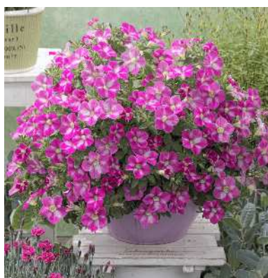
ペチュニア ハッピーシャワー