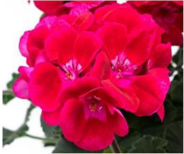
ルビーリー (パープルレッド)