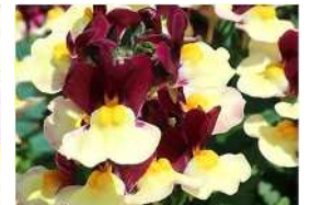
ラズベリーレモネード