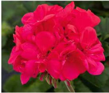
ラッキー (バイオレット)