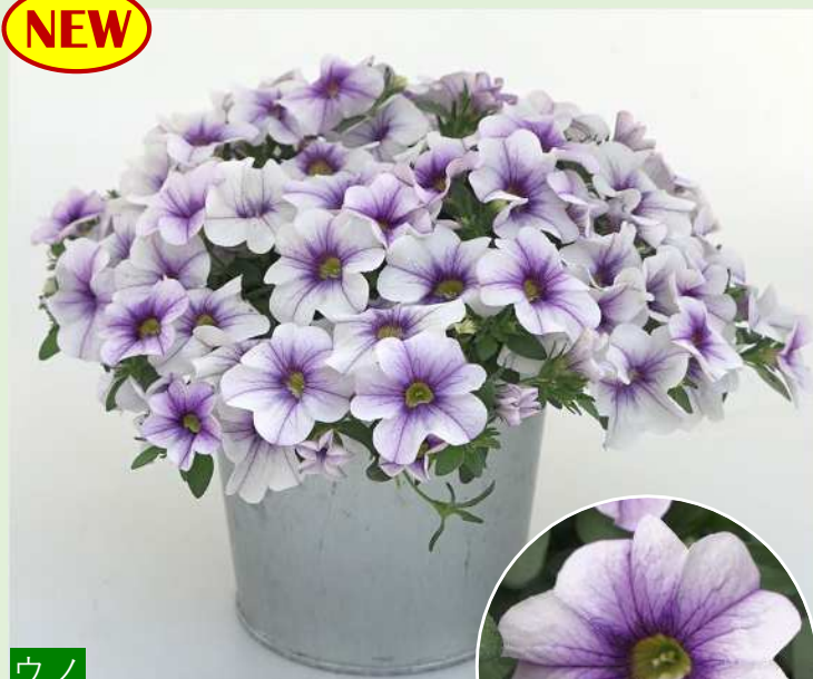
ウノ ライトブルーベイン 爽やかな花色。