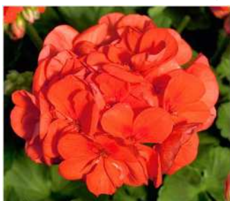
マンダリン (オレンジ)