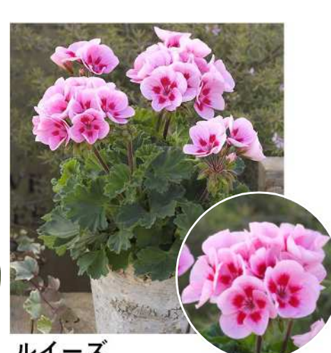
ルイズ (ライトピンクスプラッシュ)