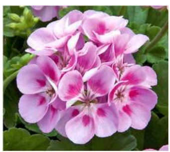
カティンカ (ピンクスプラッシュ)