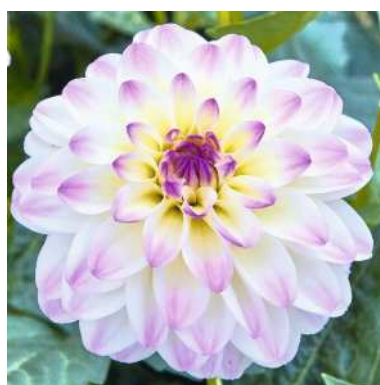
ホワイトライラック