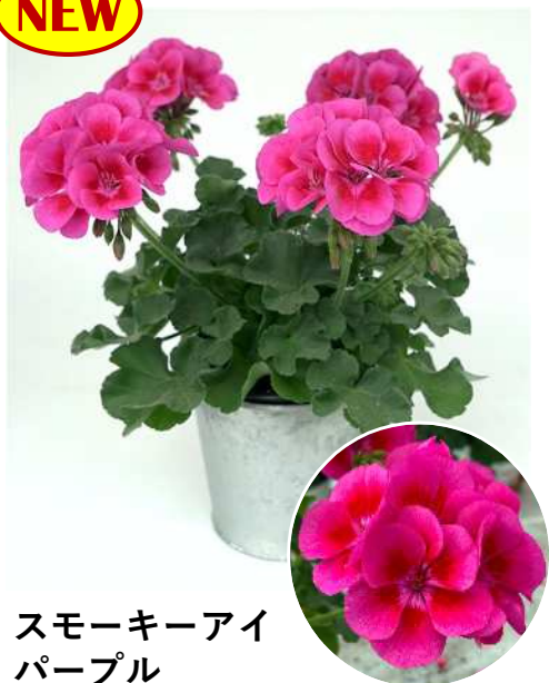
スモーキーアイ パープル