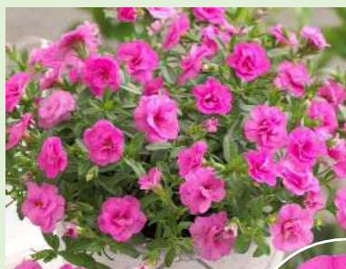
ウノダブル ピンクマニア

登録品種 (品種名:KLECA16356) 海外持出禁止 (公示(農水省HP)参照)