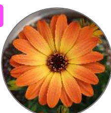
オレンジオービット