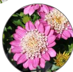
ピンクバイカラー