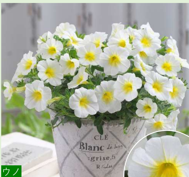
ウノ ホワイトイエローアイ