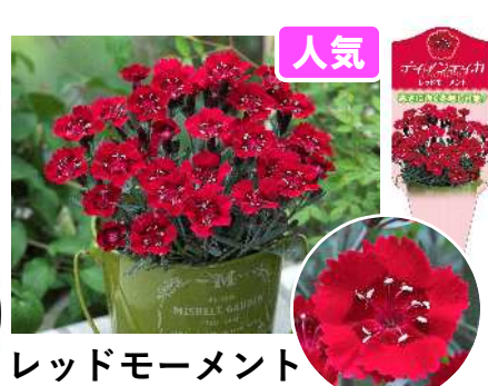
レッドモーメント