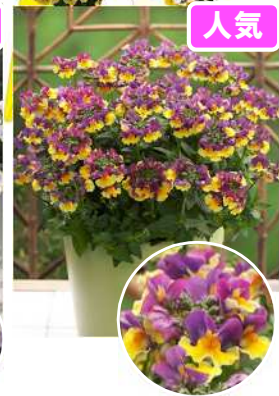
ピンクレモネード 登録品種(品種名: EASTER BONNET)