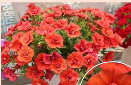
ネオダブル オレンジ