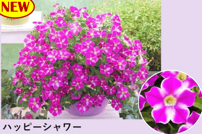
ハッピーシャワー

エッジの効いた独特の花型とユニークな花色。 まとまりのよい株特性でたくさんの花を咲かせる。