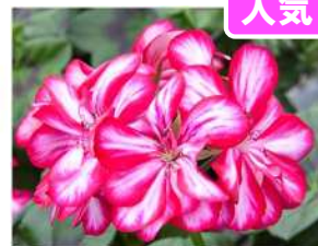
キャンディチョコ