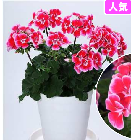
イレニア (レッド&ピンク) 赤色にピンクのエッジが入るユニーク色。 ムーンライトから移行。