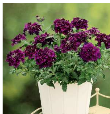
バーベナ マンハッタン