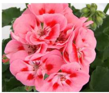
グラジエラ (サーモンピンク スプラッシュ)