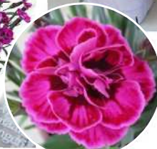
パープルウエディング®

パープル・レッド両品種ともに小輪・超多花性の早生種。 ややダークな葉色と蕾色も魅力的。 立性で作りやすい株特性。