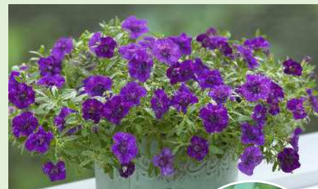
ウノダブル ブルー