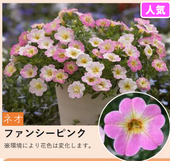
ネオ ファンシーピンク ※環境により花色は変化します。