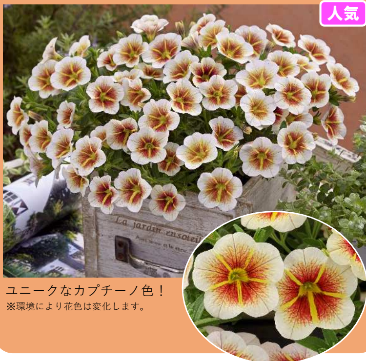
ユニークなカプチーノ色！ ※環境により花色は変化します。