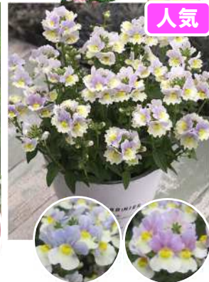
フラミンゴ 登録品種(品種名: TF1025)