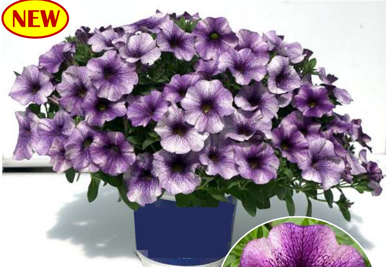
ヴィッキーバイオレット