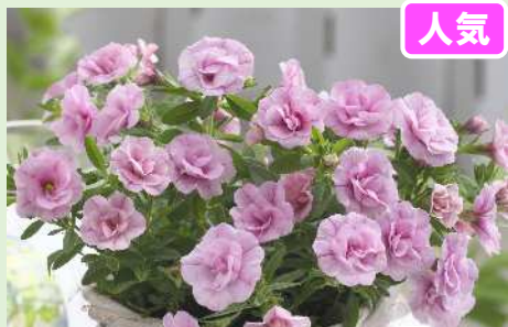
ウノダブル サクラ