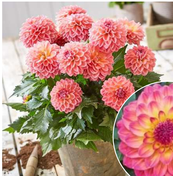
トロピカルフルーツ