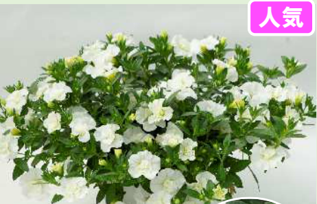
ウノダブル ホワイト'22