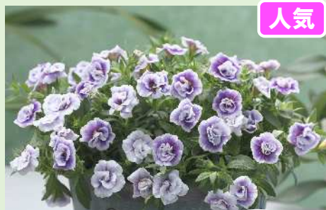
ウノダブル グレープフルル