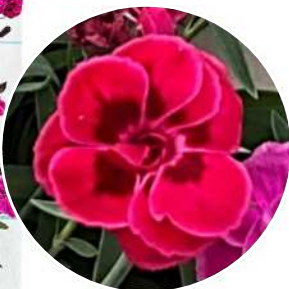
レッドウエディング ※右はパープルウエディング