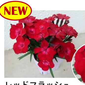
レッドフラッシュ