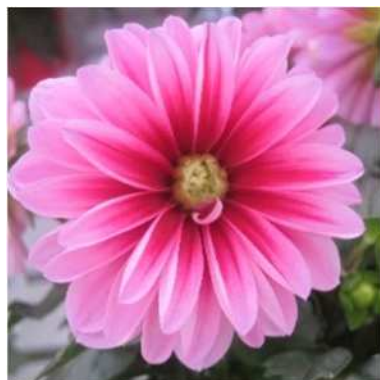
(コンパクト) ローズ&レッドアイ