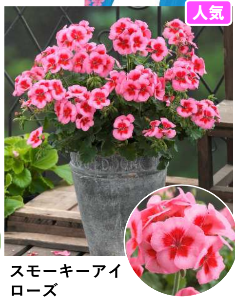
スモーキーアイ ローズ (ローズスプラッシュ)