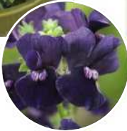
ブラックベリー 他色に比べて 株の生育が緩慢。