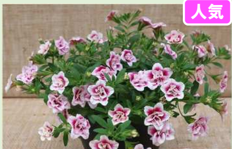
ウノダブル チェリーフルル

登録品種 (品種名:KLECA18085) 海外持出禁止 (公示(農水省HP)参照)