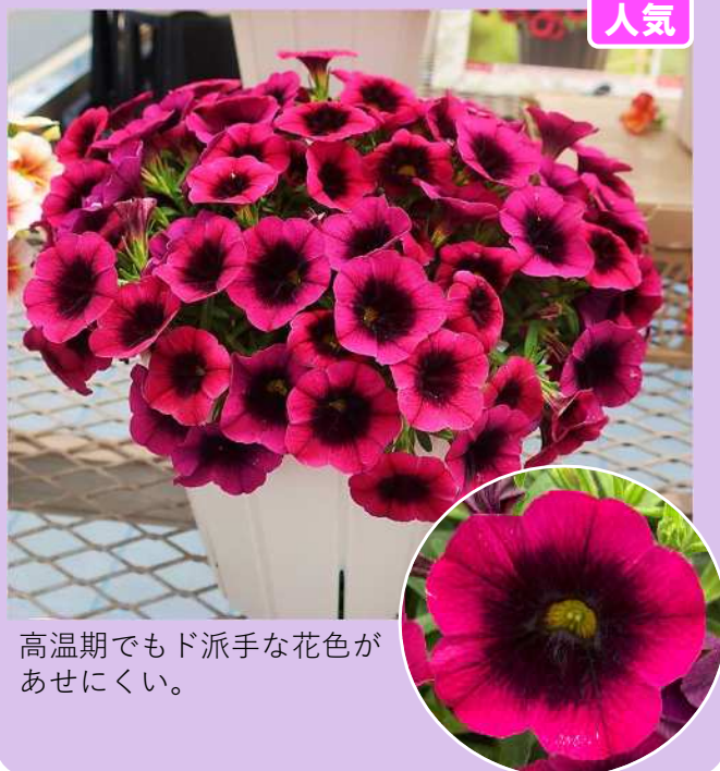
高温期でもド派手な花色が あせにくい。