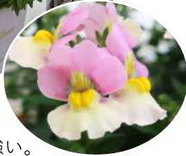
レモンパイNEO レモンパイより 花色濃く、香りが強い。