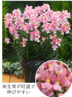
※生育が旺盛で 伸びやすい