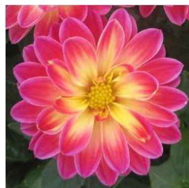
(コンパクト) バーガンディ&イエロー