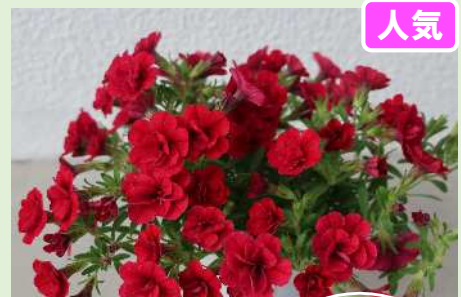
ウノダブル レッド