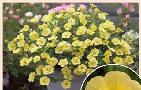
ネオダブル レモン'15