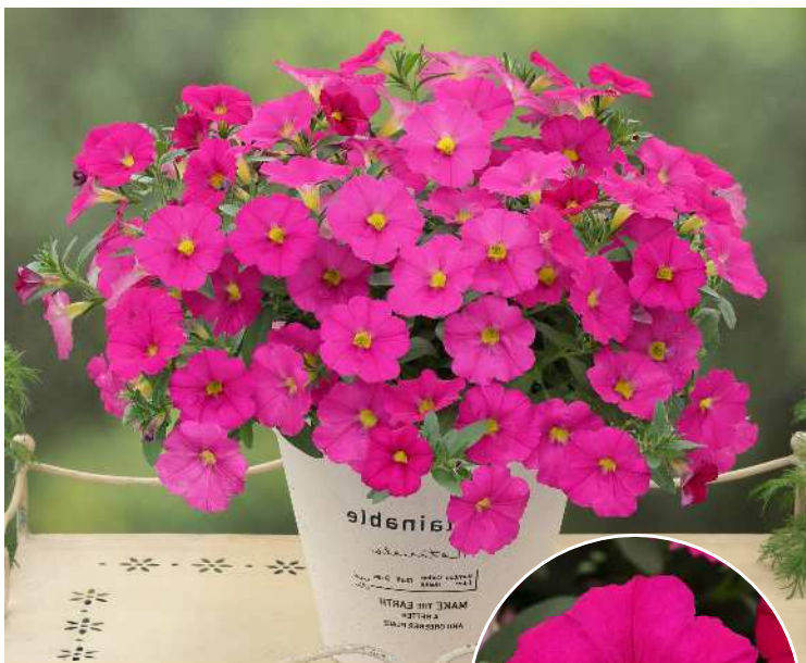
プリティーピンク