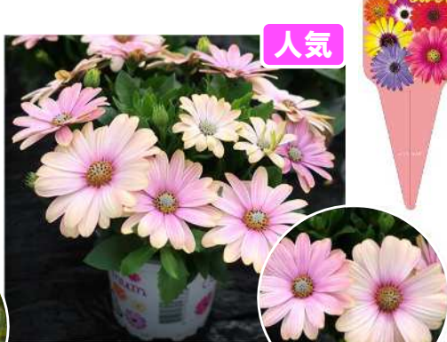
ローズサプライズ