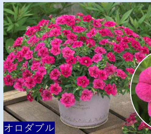
オロダブル マゼンタ