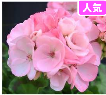
ホリー'25 (ピンクホワイト ブラッシュ)