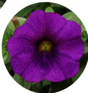
ブランディットブルー