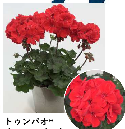
トウンバオ® オンファイア '25 (ディープスカーレット)