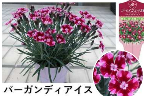
バーガンディアイス