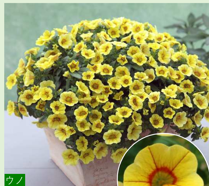
ウノ イエローレッドアイ ビビットな黄色に赤リップが ほんのり入る。