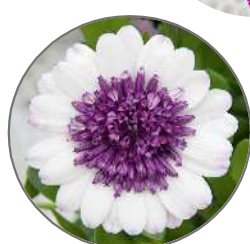
ブルーベリーシェイク