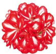
スイートキャンディ