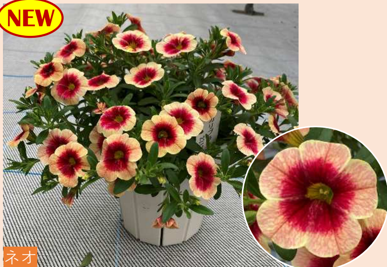
ネオ マンゴーラッシー 人気のアプリコット色。