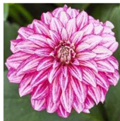
チェリーストライプ