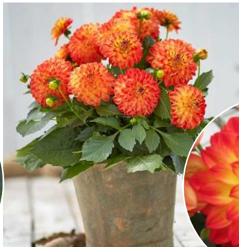
オレンジ&イエロー