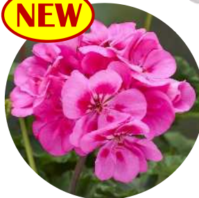
ネリア (ピンク スプラッシュ)