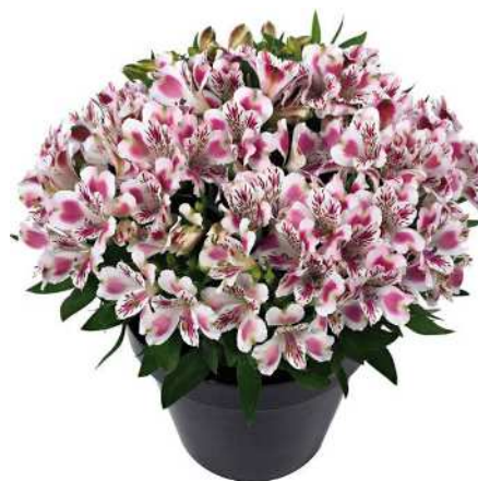
ホワイトピンクブラッシュ