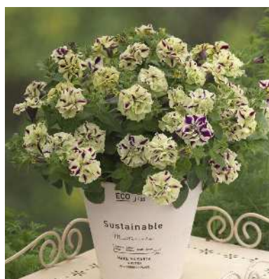
ペチュニア ピスタチオパフェ