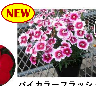
バイカラーフラッシュ