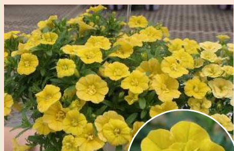
ネオダブル イエロー'23