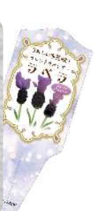
ディープバイオレット 定番色。