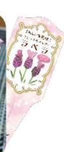
ディープピンク とてもかわいい花色。